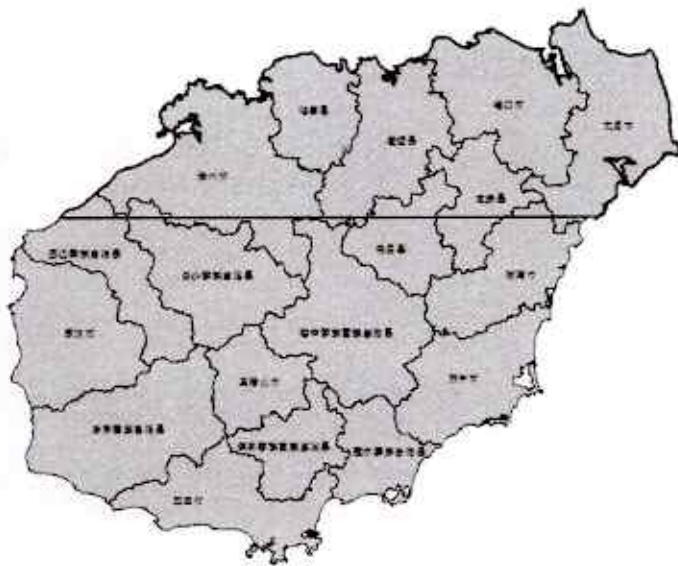
图1 DEM 入库范围

琼北地区2米格网DEM数据入库，覆盖海南岛北部区域，共1.2万平方千米，范围见图1 DEM入库范围，以及上述数据元数据入库。